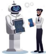
Akselerasi Otomasi & Digitalisasi