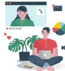
Peningkatan Tren Telework