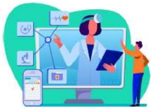
Perubahan Sistem Kesehatan

Menunjang Ekosistem Digital mengingat bahwa Pasca Covid akan terjadi berbagai perubahan peradaban, maka kondisi ini menjadi momentum bagi Perseroan berkontribusi dalam pengembangan digital dalam aspek Media dan Konten .