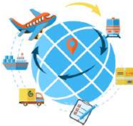
Perubahan Global Value Chain