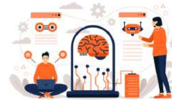
Peningkatan Peran AI & Big Data